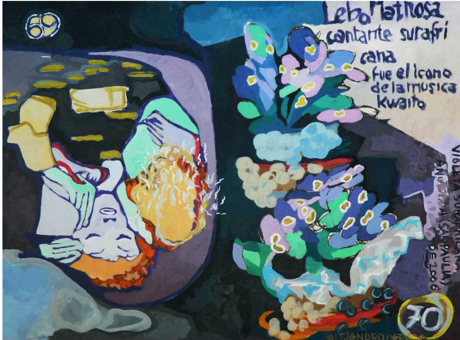
Violetas / Violets Acrílico sobre papel / Acrylic on paper. 60 x 85 cm