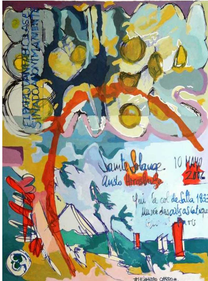
Savonarola Acrílico sobre papel / Acrylic on paper. 85 x 60 cm